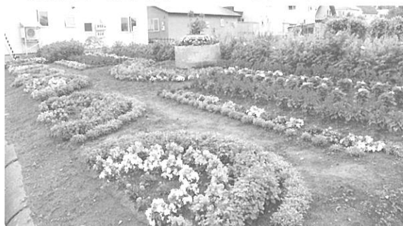
模範花壇の部(個人) マスター賞 岡崎 重雄