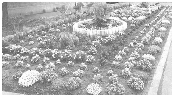
模範花壇の部(団体) マスター賞 東3区自治会