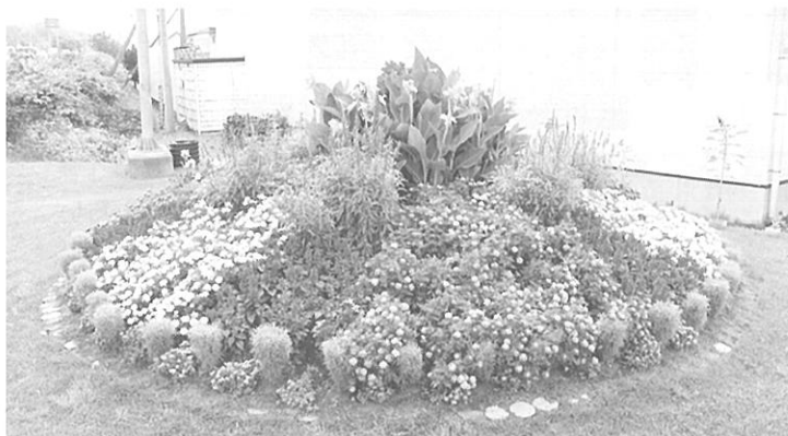
自治会花だんの部 優秀賞 長和20区自治会