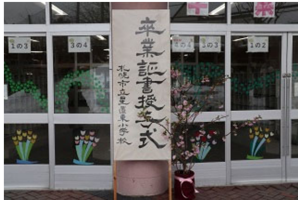
この看板の前で記念写真を撮る人が多いです

今年は5年ぶりの通常開催、数年間卒業生を見送る式に参加できなかった在校生も厳粛な式に出席して卒業生並みに緊張していました。