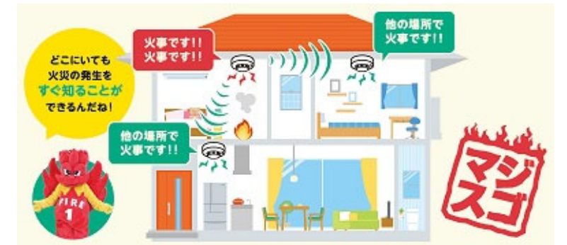
連動型 住宅用火災警報器の例