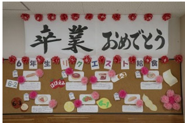
みんなで給食楽しかったよね