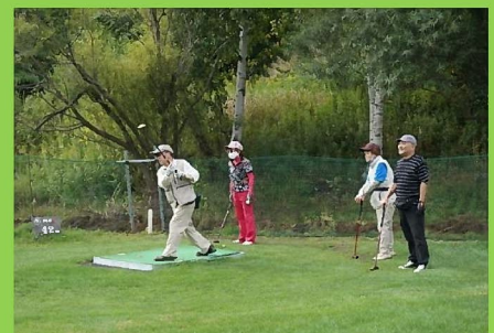
晴れやかにナイスショット！

気持ちの良い秋晴れの空の下、北広島市西の里にある山根園パークゴルフコースにて36ホールを元気にラウンドしました。今年は男女合わせて32名の参加があり大変賑やかに行うことができました。日ごろの練習の成果を発揮するべく、和気あいあいとした中にも真剣な面持ちでパークゴルフを楽しんでいました。