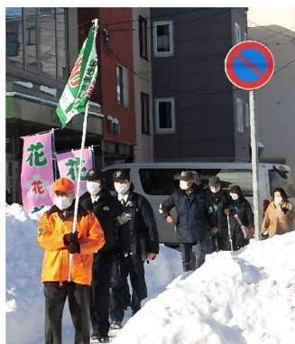
歳末特別パトロール

防犯部では、安全で安心な地域づくりのための活動を行っています。青色回転灯付車両によるパトロールで、高齢者や子どもたちの見守り等を行っているほか、年末には歳末特別パトロールを豊平警察署・月寒交番ご協力のもと行う予定です。皆様のご協力をお願いします。