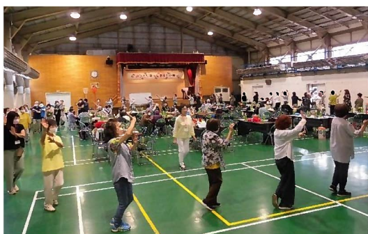
最後は輪になって月寒音頭

7月4日(火)10時から月寒公民館体育室において、「第32回おひとり暮らしお楽しみ会」が開催されました。この日は、昨年の約40人を大きく上回る約100人が参加し大盛況となりました。介護予防センター月寒の職員らによるストレッチや公民館館長の伴奏による昭和歌謡曲の合唱で体も心もほぐした後は、玉入れやビンゴゲームなどを楽