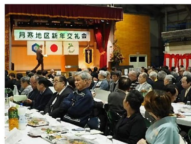
前回(令和2年)の様子

毎年1月8日に開催している「月寒地区新年交礼会」は、コロナ禍のためしばらく開催を見合わせていましたが、4年ぶりに開催することを決定しました。なお人数制限等は設けず、以前と同じ形式で実施することとしました。新年恒例の行事を楽しみにされていた皆さんの参加をお待ちしています。