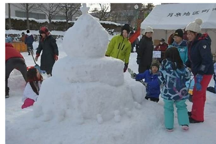
前回(令和2年)の様子

令和6年2月17日(土)・18日(日)の2日間にかけてホワイトジャンボフェスタを開催します。毎年恒例だったつきさっぷ中央公園での雪像コンテストやアイスキャンドルコンテスト、公民館での交流会など、以前と同様の規模にて再開することを予定しています。たくさんのご参加、ご来場をお待ちしています。