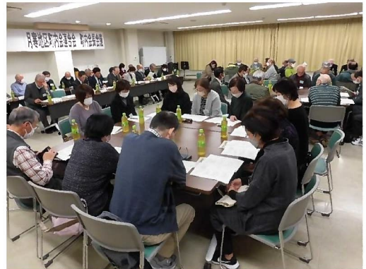
各部の報告に真剣に耳を傾ける参加者

また、今年は実に4年ぶりとなる懇親会も併せて開催され、親交を深めるとともに町内会同士の情報交換の場にもなりました。