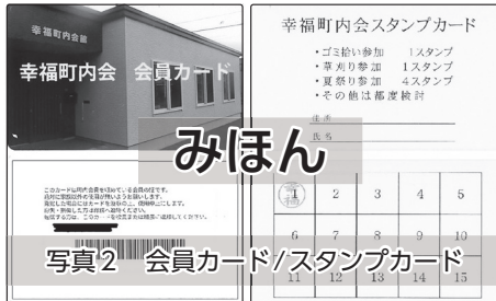
写真2 会員カード/スタンプカード

高校生以上の利用を前提にスタンプカード(写真2)もスタートしました。草刈りや夏祭りの準備など、町内会イベントのお手伝いをさせていただいた場合に押印します。スタンプが貯まると景品と交換!!という町内会活動への参加率を高めるための取組で、気軽に参加していただけるようになることを願っています。