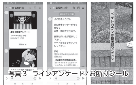
写真3 ラインアンケート/お断りシール

ホームページと併せてライン(LINE公式アカウント)を町内会員(会員の約90%)への連絡のほか会員からの苦情や相談などにも活用しています。ライン情報のメリットは伝えたい時にすぐに発信できることです。緊急の不審者情報などのほか、アンケート機能を活用して、コロナ禍で中止となっていた夏祭りやラジオ体操の参加希望をアンケート調査し(写真3)、再開の決定に役立てました。また、総会の委任状の代わりとしても活用し、その結果、委任状の回収率の大幅アップに成功しました。