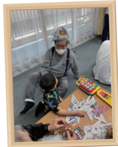
作品名 「福まち爺さんとのお話・なあ〜に」