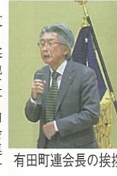
有田町連会長の挨拶