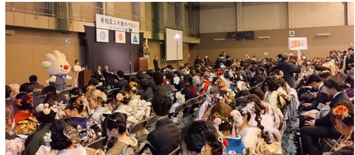
華やいだ雰囲気の成人式会場(手稲区体育館)

式典は「手稲区成人の日行事実施委員会」が主催。国歌斉唱、実施委員長と手稲区長の挨拶の後、新成人代表による「はたちの宣言」、「小学生の夢作品返還セレモニー」のほか、今年は初めて区内各中学校の先生のお祝いメッセージ上映も行われ、会場は大いに盛り上がりました。