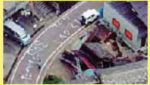
<新潟県中越地震で孤立した川口町の集落>

大きな災害が発生すると、道路の寸断や建物の倒壊、電話・水道・電気などが止まり、消防署などの防災活動が困難になることが予想されます。